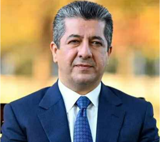
Peyama Mesrûr Barzanî wiha ye:

Serokwezîrê Kurdistanê û Cîgirê Serokê Partiya Demokrat a Kurdistanê (PDK) Mesrûr Barzanî bi boneya salvegera Şoreşa Gulanê peyamek belav kir û tê de bal kişand ser yek ji berhem û destkeftên girîng ên Şoreşa Gulanê ku ew jî dirustbûna aştiya niştimanî û yekrêzî û hevhelwestiya hêz û aliyên Kurdistanî bû.